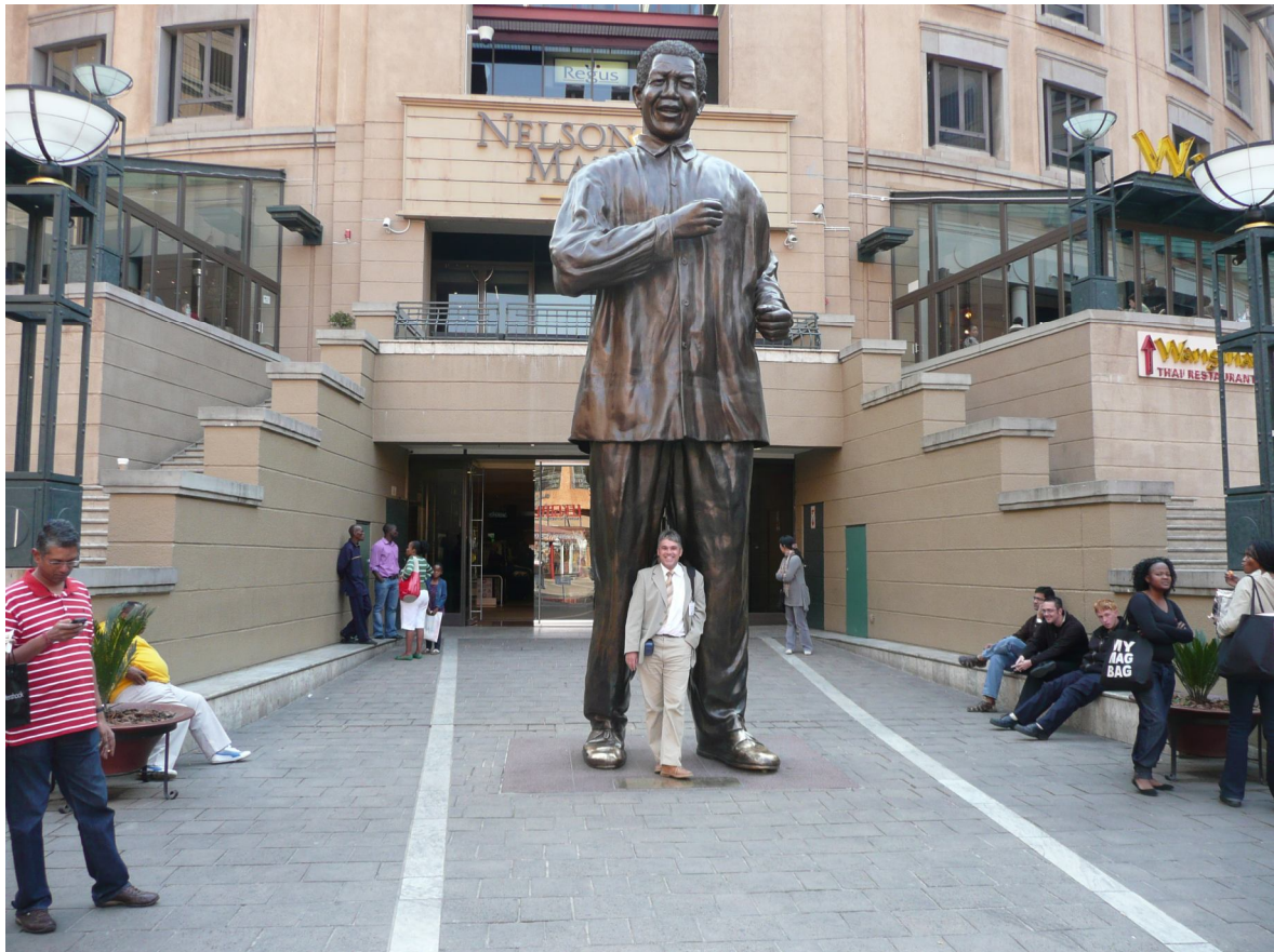
FOT. 2. Mandela jest wielki