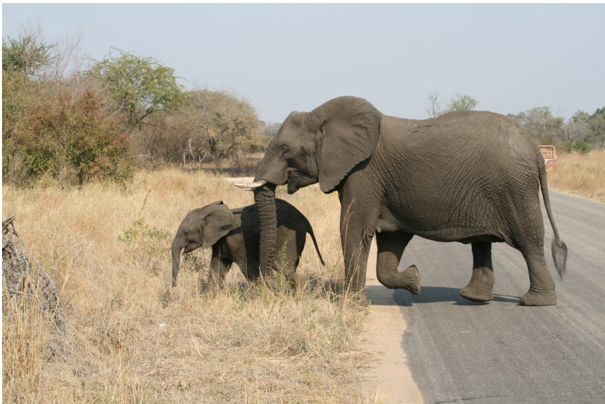
FOT. 3. Już po kongresie