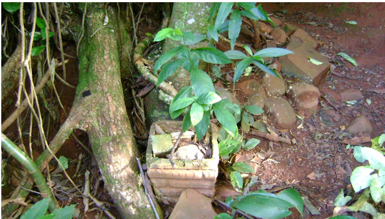
Fig. 2. Pipi ( Petiveria alliacea ) – trzymana w doniczce przed domem w celu odstraszenia złych mocy i uroków (Lanusse, listopad 2009, M. Kujawska)