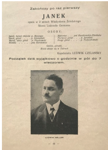
Ryc. 6. Odpis z afisza przedstawienia inauguracyjnego otwarcie nowego teatru we Lwowie