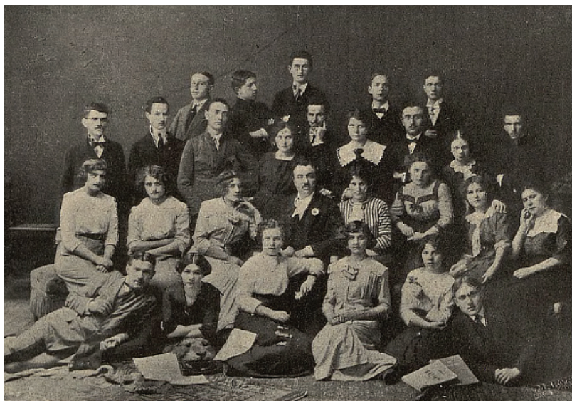
Ryc. 2. Stanisław Bursa (w środku) z grupą swoich uczniów ze Szkoły Śpiewu Stanisława Bursy