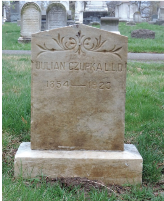
Ryc. 3. Nagrobek J. Czupki