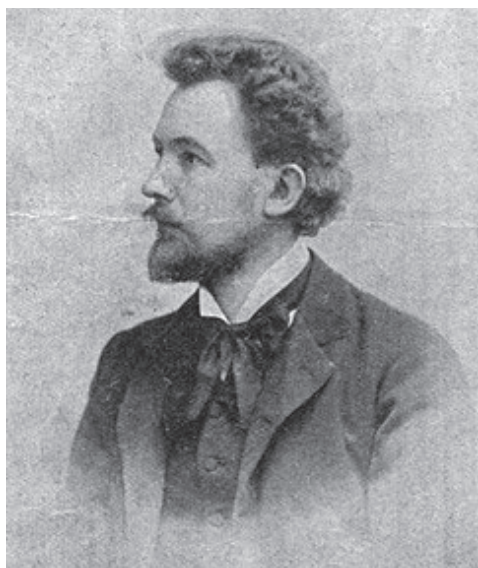
Ryc. 1. Antoni Uruski (1872–1934)

Inicjatorem założenia rzeszowskiej „Lutni” był Antoni Uruski, ceniony kompozytor, pianista, a przede wszystkim pedagog 7 . Uruski był niezwykle aktywnym animatorem muzyki w wielu miasteczkach galicyjskich, w Rzeszowie uczył muzyki i śpiewu w Seminarium Nauczycielskim Męskim. Przyjechał tu w 1903 r., zamieszkując przy ul. 3 Maja. W jego mieszkaniu stanął nie tylko fortepian, ale zasobna biblioteka muzyczna, wkrótce zaczęły się tu także odbywać próby kwartetu męskiego, z którego w niedługim czasie Uruski stworzył dwudziestoosobowy chór 8 . W zaskakującym tempie rosła liczba chórzystów i pod koniec roku było to już 70 członków, a poza chórem męskim stworzono także chór mieszany. Zespół przeniósł się do budynku Kasyna i rozpoczął próby. Przyjął też formę Towarzystwa Muzycznego pod nazwą „Lutnia”.