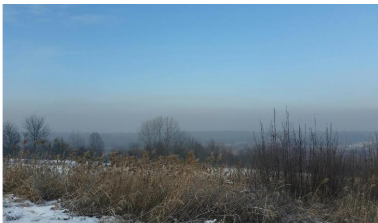
Fotografia 1. Smog siarkowy w Krakowie w styczniu 2017 r. (dzielnica Bielany)

Kraków jest jednym z najbardziej zanieczyszczonych miast w Europie, gdzie w okresie grzewczym każdego roku występuje zjawisko kwaśnego smogu (fot. 1).