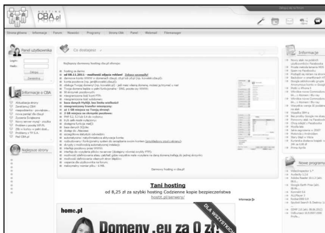
Rys. 1. Wygląd okna strony cba.pl