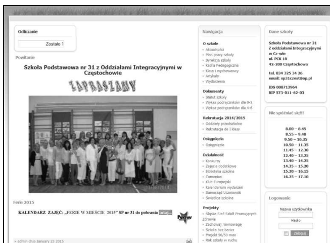
Rys. 3. Oficjalna strona internetowa Szkoły Podstawowej nr 31 w Częstochowie

Zgodnie z funkcją poszczególnych paneli administracyjnych oraz ich sub-menu dokonujemy edycji elementów w postaci graficznej oraz tekstowej. Zalogowanie się poprzez podanie loginu i hasła administratora strony umożliwi ewentualną korektę projektu oraz uaktualnienie zawartości strony internetowej.