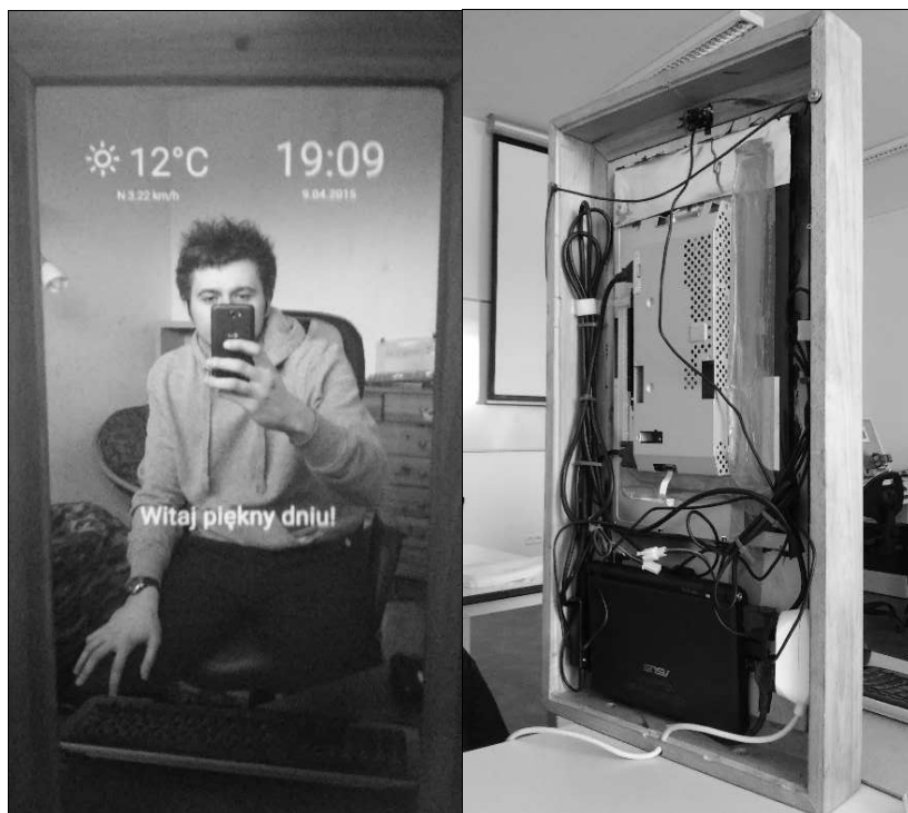
Rys. 2. Zdjęcia prezentujące działające urządzenie oraz wnętrze lustra