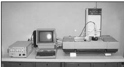
Rys. 1. Pierwsza komercyjna drukarka 3D – zestaw do stereolitografii

Pierwsza drukarka 3D wykorzystująca stereolitografię do zastosowań komercyjnych, również opracowana przez Hulla, powstała w 1992 r. (rys. 1). Do komunikacji z komputerem drukarka ta wykorzystywała format plików STL, a jej twórca za pomocą tego urządzenia stworzył dla swojej żony filiżankę do herbaty [WWW4].