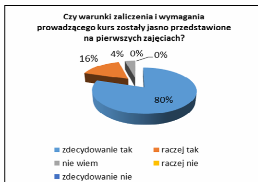
Rys. 3. Jasność i jednoznaczność warunków zaliczenia i wymagań przekazywanych przez nauczyciela na początku zajęć

Pytania otwarte skierowane do studentów – uczestników zajęć prowadzonych w formule blended learning dotyczyły ewentualnej zmiany w zakresie sposobu realizacji e-kursu. Większość studentów nie widziała takiej potrzeby. Według respondentów, duże znaczenie miała dostępność materiałów dydaktycznych, przystępność przygotowanych treści, możliwość sprawdzenia poziomu opanowania treści kształcenia poprzez udział w quizach, testach oraz brak konieczności dojazdu na uczelnię. Jednocześnie podkreślono możliwość bezpośredniego kontaktu z prowadzącym w trakcie zajęć stacjonarnych. Natomiast dość krytycznie badani odnieśli się do elektronicznej formy prezentacji treści, podkreślając potrzebę wydruku materiałów dydaktycznych. Studenci oczekują umieszczenia w kursie większej liczby webcastów, quizów, zadań, krzyżówek, głosowań oraz zastosowania elementów rywalizacji. Duże znaczenie dla uczestników kursów miał również stosowany przez nauczycieli system przypomnień i motywacji oraz regularna obecność prowadzącego na platformie. Zebrane uwagi zostały przekazane osobom prowadzącym e-kursy i omówione na Seminarium Praktyków E-learningu. Badania mają charakter longitudinalny.