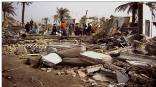
Fot. 2. Skutki wybuchu samochodu pułapki (największe skupiska ludzi)

Przykład ataku na bazę Camp Charlie w Al Hillah w trakcie którego 58 żołnierzy dywizji zostało rannych, w tym 7 polskich, 1 amerykański zostali ewakuowani helikopterami do Bagdadu. Jednocześnie w trakcie ataku zginęło 2 lokalnych cywili, 44 zostało rannych oraz zburzono 14 domów (sytuacja po ataku z dnia 18 lutego 2004 r.).