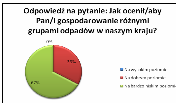
Rys. 2. Odsetki odpowiedzi udzielonych przez respondentów na pytanie 7

stwierdził, że gospodarka odpadami w Polsce jest na wysokim poziomie. Udzielone odpowiedzi świadczą o niezadowoleniu społeczeństwa z działalności władz i samorządów oraz z braku właściwej organizacji działań w tym zakresie.