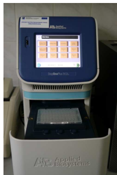
Rys. 2. Real-Time StepOnePlus (Applied Biosystems)

W laboratorium znajduje się aparat do detekcji Real-Time StepOnePlus (Applied Biosystems) (rys. 2). Reakcje przeprowadzane są na płytkach umożliwiającym jednocześnie wykonanie 96 analiz.