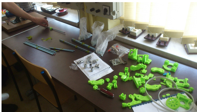
Fot. 1. Elementy potrzebne do złożenia drukarki 3D

Aby rozpocząć budowę, potrzebowaliśmy wydrukowanych na innej drukarce plastikowych elementów ramy, dodatkowych silników krokowych, dyszę ekstrudera, elektronikę sterującą, dodatkowych rezystorów podgrzewających blat roboczy, paski oraz elementy metalowe. Większość wymienionych przedmiotów można zakupić w lokalnych sklepach z materiałami budowlanymi, pozostałych należy szukać u osób, które same tworzą drukarki przestrzenne i chętnie udzielają pomocy.