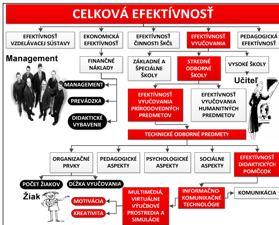
Obr. 1. Efektívnosť vyučovania a jej elementy