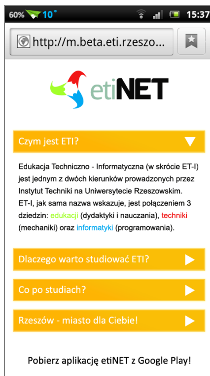
Rys. 3. Zrzut ekranu mobilnej wersji strony dla kandydatów