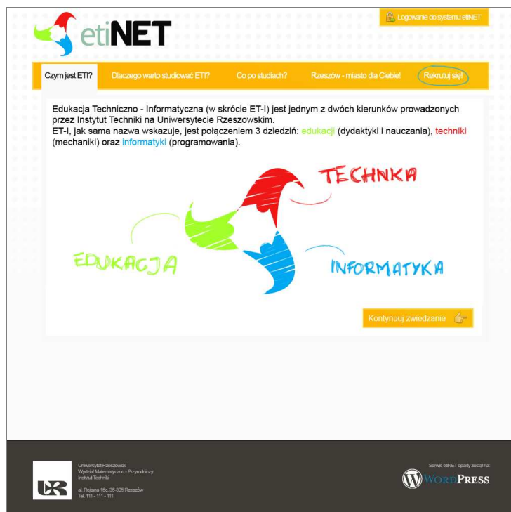
Rys. 2. Zrzut ekranu strony dla kandydatów

W założeniu osoby zainteresowane studiowaniem na kierunku ET-I po wejściu na adres http://beta.eti.rzeszow.pl znalazłyby informacje dotyczące studiowania na kierunku ET-I, korzyści płynących z ukończenia tego kierunku studiów oraz na temat Uniwersytetu Rzeszowskiego i samego Rzeszowa. Ponadto, na stronie znajdowałyby się linki przekierowujące do strony rekrutacyjnej oraz panelu logowania dla studentów i nauczycieli akademickich.