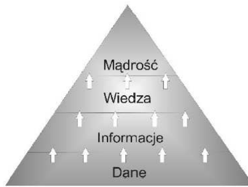
Rys. 1. Piramida mądrości

Jak twierdzi C. Cempel, na płaszczyźnie rozumienia siebie i świata, będącego istotnym składnikiem postępu, wiedza jest jedynym z ostatnich pięter, przed mądrością i powstaje z danych, by poprzez kolejne agregacje i połączenia dać informację, w dalszym ciągu tego samego procesu wiedzę, a na końcu mądrość [Zieliński 2009].