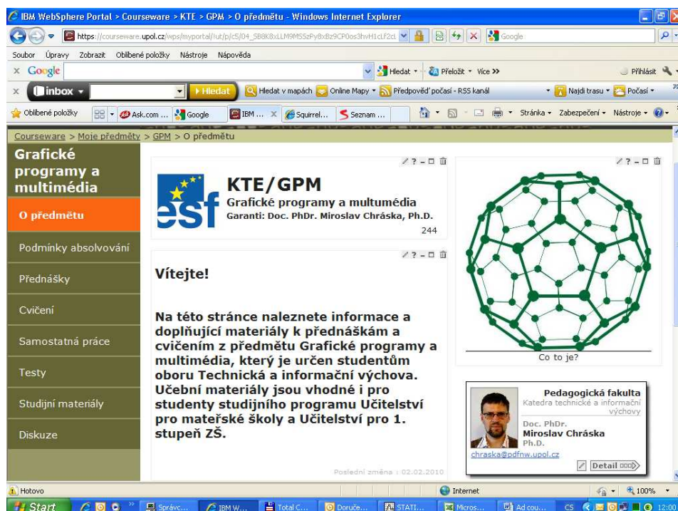
Obr. 2. Systém Courseware – předmět grafické programy a multimédia

V každé z výše uvedených částí má učitel možnost, mimo zadávané texty, vložit i dokumenty nebo odkazy na dokumenty, které se nacházejí na internetu. Tyto dokumenty je možné zpřístupňovat jen určitým skupinám uživatelů (viz obr. 3) nebo je zveřejňovat jen v určitém časovém období. Vyučující má možnost též prostřednictvím Courseware zadávat aktuality, týkající se předmětu, vypisovat termíny zkoušek a zapisovat známky do systému STAG.