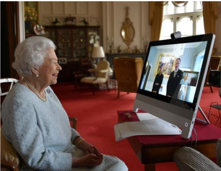
2. Virtual diplomatic audience

Prezentacja źródeł