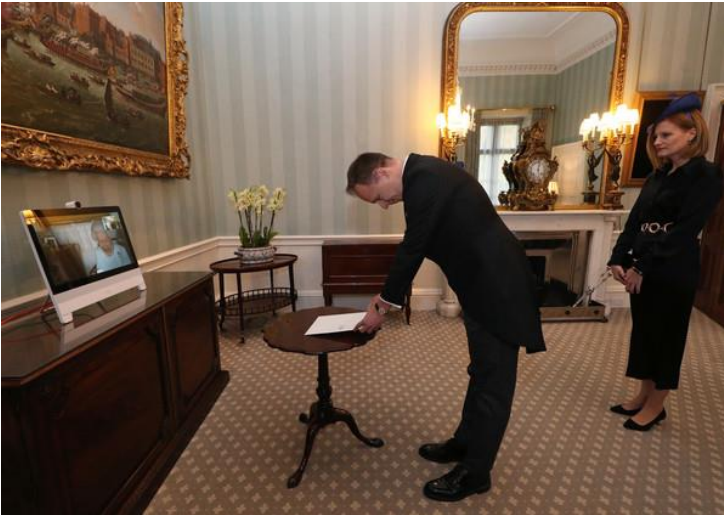
1. Presentation of Credentials

Letters of Recall of his predecessor and his own Letters of Credence as Ambassador from Hungary to the Court of St. James's. Mrs. Kumin was also received by Her Majesty via video link.”