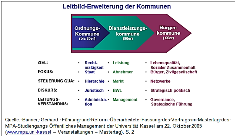
Abb. 1. Leitbilderweiterung der Kommunen