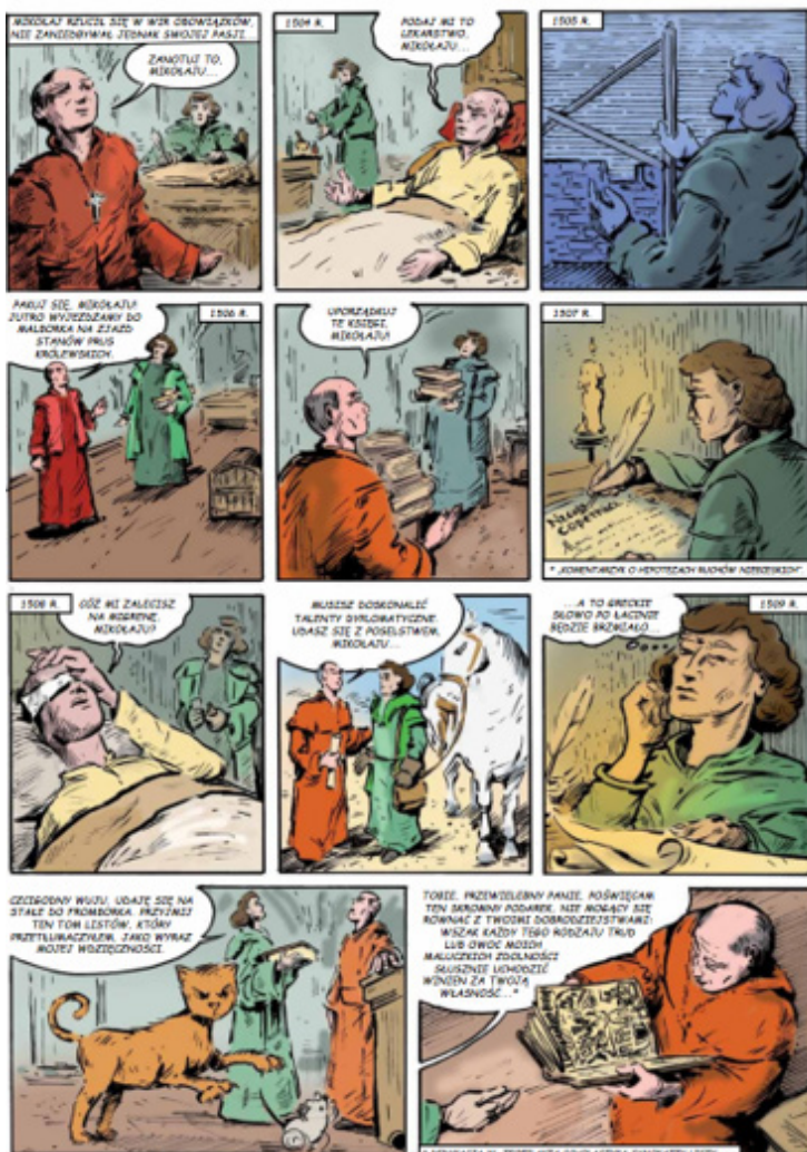
Rys. 5. Kopernik człowiekiem renesansu