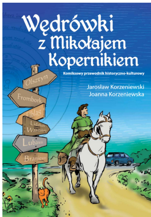
Rys. 1. Okładka

Czytelnik rozpoczynając przygodę z przewodnikiem włączony zostaje (jak mówi sam tytuł) w podróż – wędrowkę, którą odbywają fikcyjni bohaterowie – czteroosobowa rodzina. Poznaje ona miejsca związane z Mikołajem Kopernikiem znajdujące się w województwie warmińsko-mazurskim wpisane w Szlak Kopernikowski. Aglomeracje stanowią o dziedzictwie kulturowym tego regionu, a ich dzieje na stałe wpisały się do historii ogólnopolskiej i światowej.