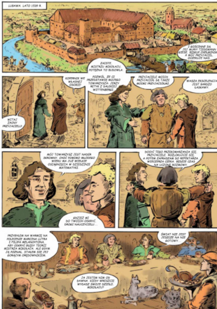
Rys. 3. Kopernik spotyka się z Retykiem

(niemieckiego uczonego, matematyka, astronoma i lekarza), z którym współpracował po przybyciu do Fromborka w 1539 r. Tak jak na kartach komiksu tak też w rzeczywistości Kopernik udostępnił mu swoje dzieło De Revolutionibus .