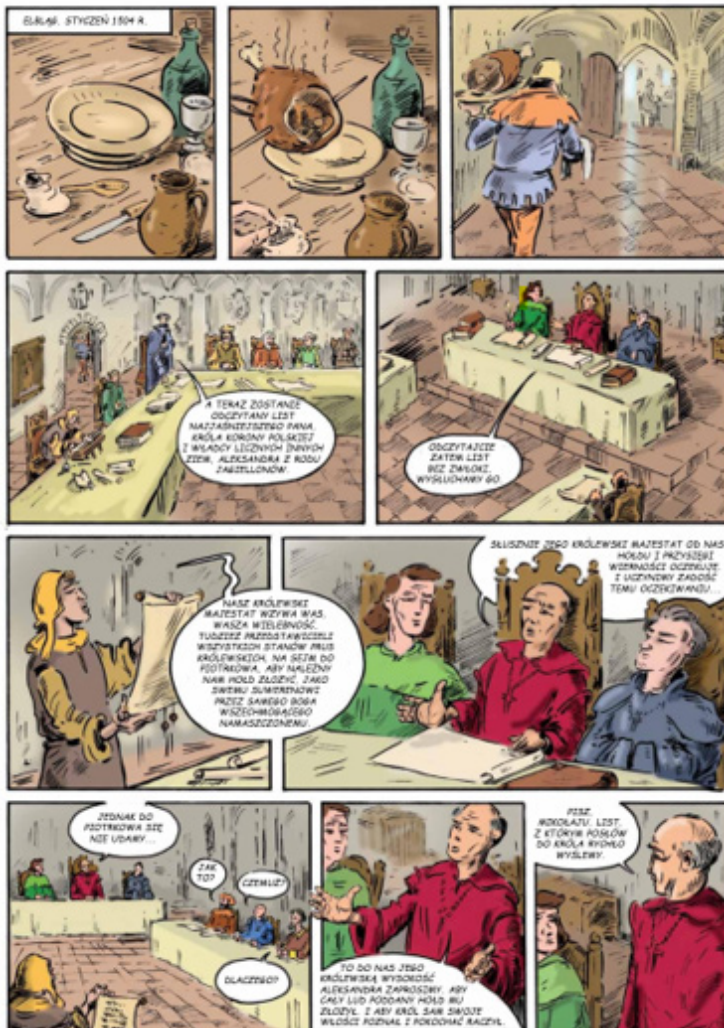
Rys. 6. Obyczajowość w XVI w.

polskich założonej przez jezuitów w XVI w. We Fromborku zaś bohaterowie rozmawiają o rozterkach, które targały Kopernikiem w momencie tworzenia teorii heliocentrycznej – jego obawach, czy świat jest gotowy na zmianę dotychczasowego myślenia o świecie i wszechświecie.