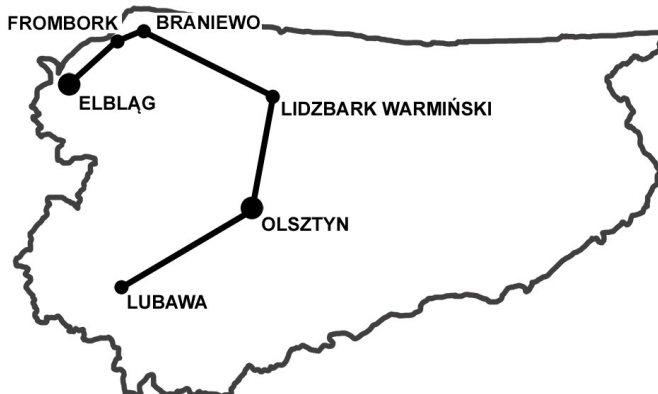
Mapa 1. Trasa wędrówki z Mikołajem Kopernikiem