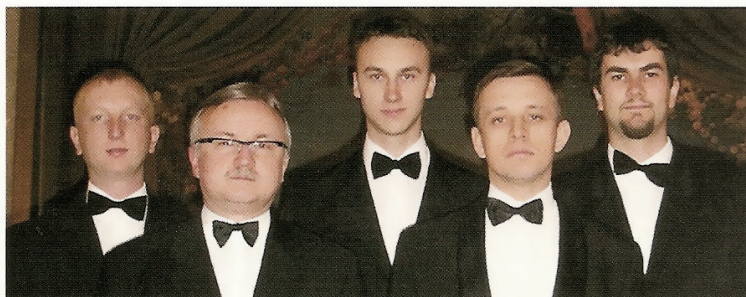
Ilustracja 4. Fragment okładki płyty CD Podkarpackiego Kwintetu Akordeonowego „Ambitus V”, fot. ze zbiorów Mirosława Dymona

PODKARPACKI KWINTET AKORDEONOWY AMBITUS V