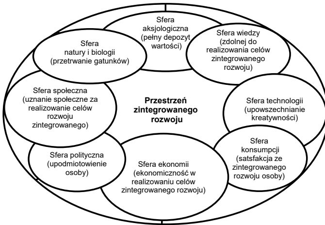
Rys. 1. Kryteria wartościowania osoby zorientowanej na rzecz zintegrowanego rozwoju

pomijając, że w poszukiwaniach lepszego życia, wartościowego życia ludzie pragną kierować się kryteriami wartościowania właściwymi dla całej przestrzeni bycia i działania człowieka (rys. 1). W związku z tym wykazują skłonność do respektowania nie tylko ekonomicznych, społecznych czy politycznych kryteriów wyboru, ale również duchowych, wynikających z wiedzy, własnej biologii i swoich relacji ze środowiskiem bytowania, w tym również naturalnego, potrzeby jego ulepszenia i podnoszenia jakości życia oraz hierarchii potrzeb.