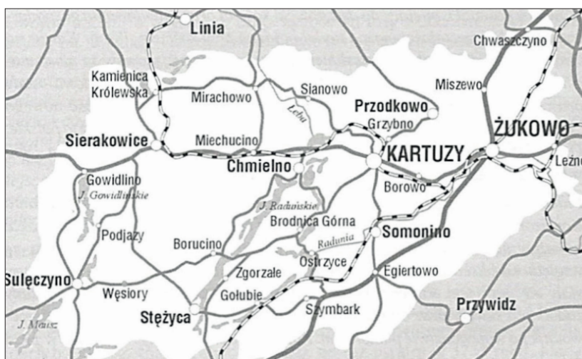
Rys. 1. Najważniejsze miejscowości turystyczne powiatu kartuskiego

Obecnie w powiecie istnieje dość dobrze rozwinięta baza noclegowa, sieć gastronomiczna i liczne krajobrazowe atrakcje (rys. 1). Głównym ośrodkiem miejskim są Kartusy, położone w odległości ok. 40 km od Trójmiasta, a centrami turystycznymi – miejscowości usytuowane przy tak zwanym Kółku Raduńskim (Chmielno, Łączyń, Zgorzałe, Stężyca, Gołubie, Ostrzyce, Brodnica) oraz leżące nad jeziorami Sulęcyno i Gowidłino (Ellwart, 2009, s. 185).