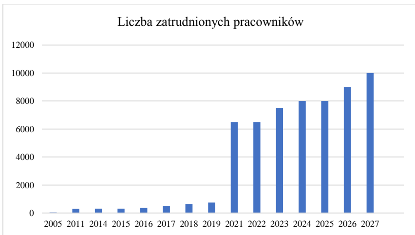
Wykres 1. Dynamiczny wzrost kadrowy Fronteksu w latach 2005–2027

Zwiększenie zakresu obowiązków wiąże się również z poszerzeniem możliwości operacyjnych i ekonomicznych. Wykres 1 ukazuje okres od 2005 do 2027 roku, czyli od początku działalności Fronteksu, aż po szacowane zmiany, do których ma dojść w najbliższych kilku latach. Dane zawarte na tym wykresie obrazują liczbę pracowników, którymi dysponowała Agencja w pierwszych latach swojego istnienia, podczas rozkwitu kryzysu migracyjnego, jak i prognozowaną ich liczbę w najbliższych sześciu latach, co do których planowany jest rozkwit struktury Straży. Wykres 2 odzwierciedla natomiast wysokość rocznego budżetu operacyjnego Fronteksu, ukazując jego dynamiczny wzrost.