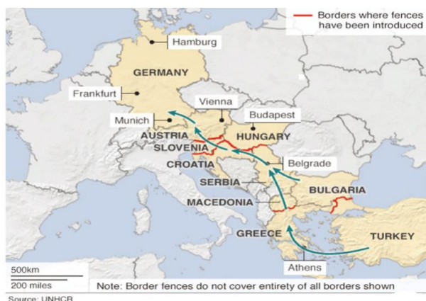
Schemat 1. Szlak zachodniobałkański 2013–2016

Zachodniobałkański szlak migracyjny stanowił lądowe przedłużenie szlaku wschodniośroziemnomorskiego. Szczegółowy jego przebieg przedstawiono na schemacie 1.