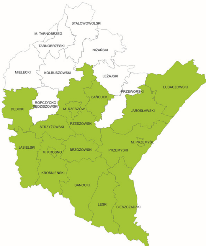
Ryc. 2. Obszar koncentracji działań na rzecz podnoszenia konkurencyjności produktów turystycznych

O ile dwa pierwsze kierunki powinny być realizowane na obszarze całego Podkarpacia, o tyle kierunek trzeci – w ramach OSI, obejmującego południową i środkową część regionu (ryc. 2).