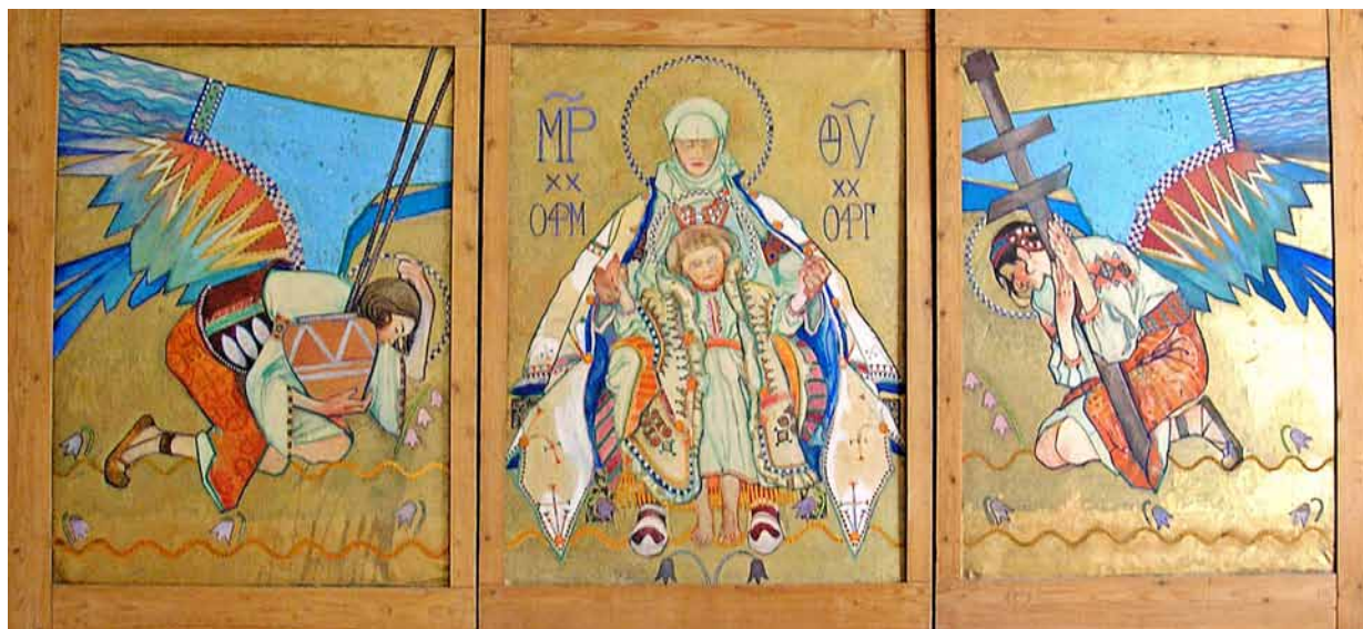
6. Kazimierz Sichulski, Madonna huculska , tryptyk, 1914, papier na płótnie, technika mieszana, Lwowska Narodowa Galeria Sztuki im. B. Woźnickiego, fot. J. Biriulow