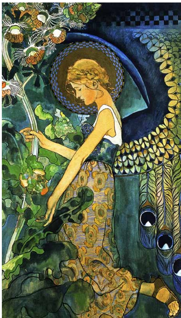
7. Kazimierz Sichulski, Anioł (Adoracja Madonny) , 1911, technika mieszana, Muzeum Narodowe w Poznaniu, fot. z archiwum J. Biriulowa