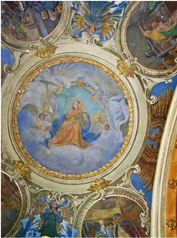
1. Tadeusz Popiel, polichromia kaplicy Matki Boskiej Pocieszenia, detal, 1905, kościół Jezuitów, Lwów