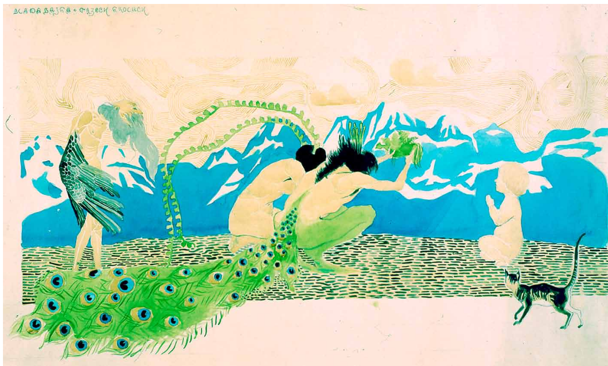
8. Marian Olszewski, Blada bajka o Trzech Królach , 1910–1913, papier, technika mieszana, Lwowska Narodowa Galeria Sztuki im. B. Woźnickiego, fot. J. Biriulow