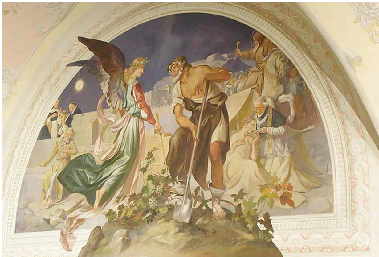
3. Karol Polityński, Chrystus Ogrodnik , 1906, fragment polichromii sali klasztoru Dominikanów we Lwowie (obecnie Muzeum Historii Religii, Lwów)