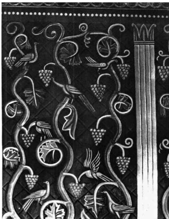
11. Mychajło Bojczuk, polichromia dawnej Bursy Diaków Katedry św. Jura, detal, 1912–1913, fot. archiwalna