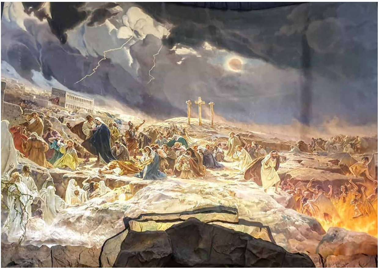
2. Tadeusz Popiel, Golgota , 1910, olej, płótno, 800 x 1000 cm, kościół Bernardynów, Kraków, fot. z archiwum J. Biriulowa

2. Tadeusz Popiel, Golgotha , 1910, oil, canvas, 800 x 1000 cm, the Bernardine Observant Church, Krakow, phot. from the archive of Y. Biryulov