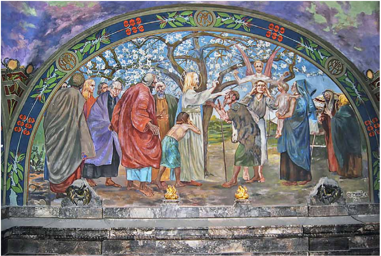
4. Stanisław Dębicki, Uzdrowienie ślepego , 1904, fresk, kaplica Jezusa Miłosiernego, katedra łańciska, Lwów, fot. J. Biriulow