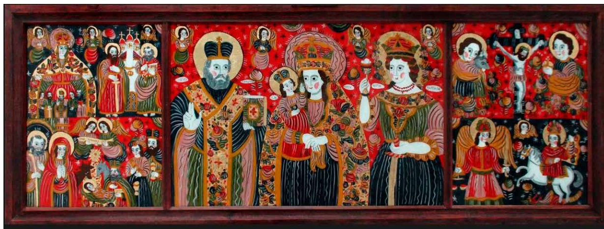
3. Ostap Łozynskij, Boże Narodzenie, Bogurodzica Pokrowa, Apostolowie Piotr i Paweł, św. Mikołaj, Matka Boska Leżajska, św. Barbara, Archanioł Michał, św. Jerzy, Ukrzyżowanie, Jan Chrzciciel i Jezus Chrystus w dzieciństwie , 2020, szkło, tusz, akryl, złoto płatkowe, prywatna kolekcja