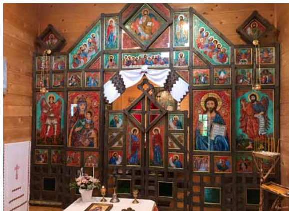
8. Oksana Wynnyczok, ikonostas kaplicy klasztoru Przemienienia Pańskiego, wieś Dzembronia, obwód iwanofrankiwski, 2014, szkło, tusz, olej, złoto płatkowe

In addition to family icons, the author also created a unique iconostasis for the chapel of the Basilian Monastery of the Transfiguration in the village of Dzembronia, located in the Carpathian Upland. It is safe to say that it represents the pinnacle of Oksana Wynnyczok's achievement in glass painting. It is a 400x370 cm ensemble with the full structure of a four-tiered Orthodox church iconostasis. It consists of 34 paintings and royal doors [fig. 8]. According to the iconography, these are church icons filled with a variety of ornamental motifs. The clothing of the saints is clearly reminiscent of folk embroidery, while the background is more abstract and schematic. In contrast, the centrally located icons of the Virgin with Child and Christ the Saviour are characterised by their expressive floral settings [fig. 9]. The saturation of the surfaces with decorative elements