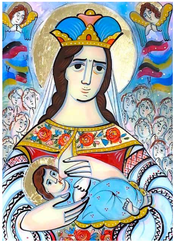
27. Ulana Krechowec, I będzie Syn, i będzie Matka... , 2022, szkło, akryl, tempera, tusz, złoto płatkowe, zbiory prywatne

26. Uliana Krekhovets, There Will Be a Son and a Mother , 2022, paper, liners, watercolour markers, private collection