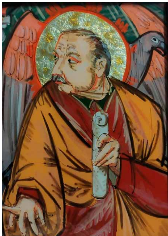
18. Taras Łozynskyj, św. Jan Ewangelista , 1998, szkło, tusz, olej, folia, zbiory Ukraińskiego Uniwersytetu Katolickiego