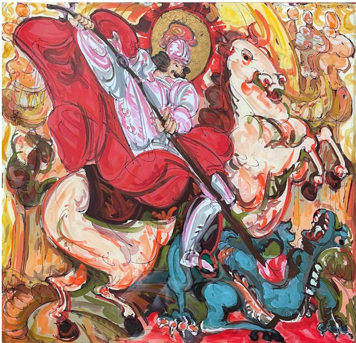
22. Taras Łozynskij, św. Jerzy , 2001, szkło, tusz, olej, folia, zbiory prywatne, fot. O. Triska