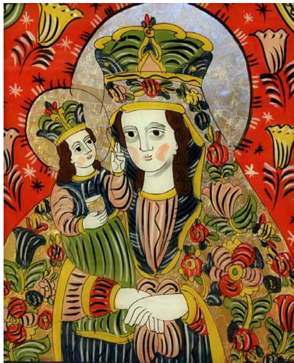
2. Ostap Łozynskij, Matka Boska Leżajska , 2010, szkło, tusz, akryl, złoto płatkowe, zbiory prywatne, fot. O. Łozynskij

In order to enhance the expressiveness of the work, the artist frequently placed his pieces in old