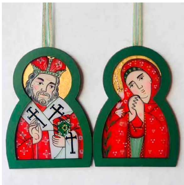
24. Ulana Krechowec, św. Mikołaj, Dziewica Maryja (z cyklu Moi mili Bożie ), 2020, szkło, akryl, tempera, tusz, własność prywatna