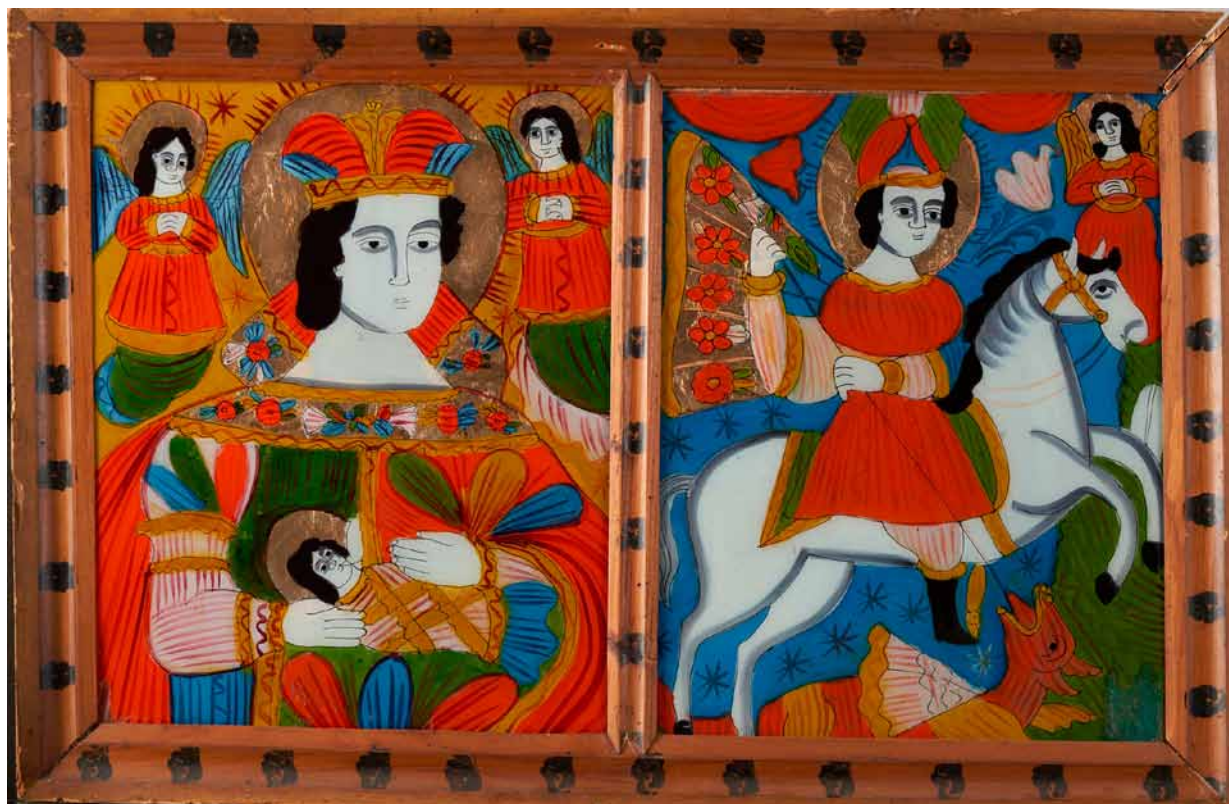
1. Matka Boska, św. Jerzy , ikona ludowa na szkle, Pokucie, ostatnia ćwierć XIX wieku, prywatna kolekcja