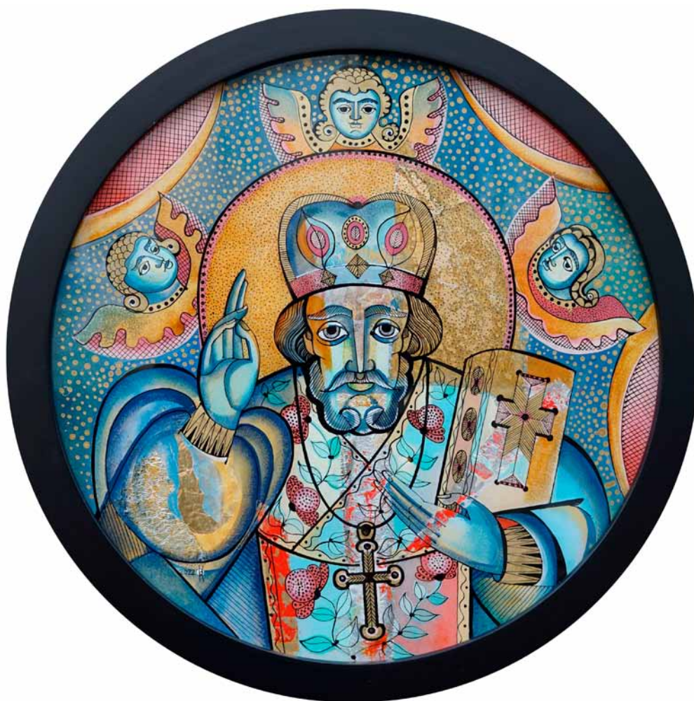
17. Oksana Romaniw-Triska, św. Mikołaj , 2022, szkło, tusz, olej, folia, kolekcja prywatna, fot. O. Romaniw-Triska