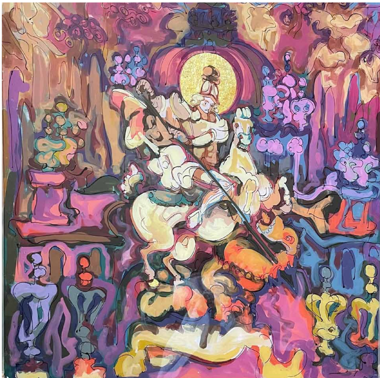
21. Taras Łozynskij, św. Jerzy , 2011, szkło, tusz, olej, folia, zbiory prywatne