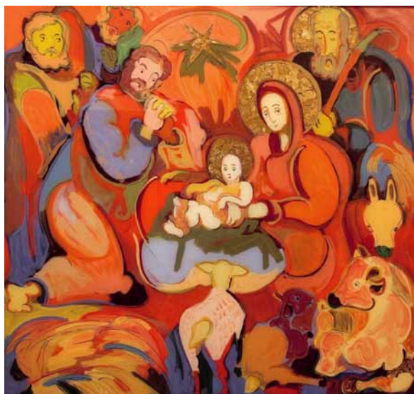
20. Taras Łozynskij, Boże Narodzenie , 2010, szkło, tusz, olej, folia, zbiory prywatne