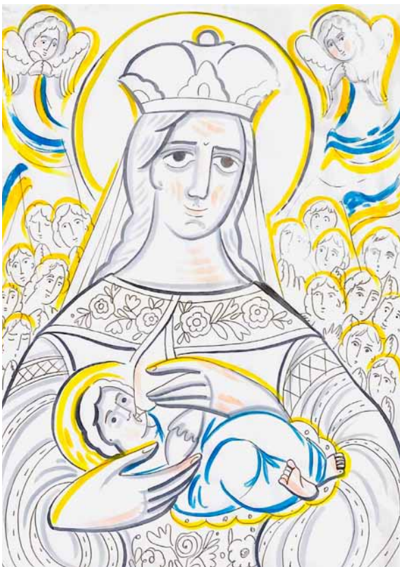
26. Ulana Krechowec, I będzie Syn, i będzie Matka... , 2022, papier, linijki, markery akwarelowe, kolekcja prywatna, fot. U. Krechowec

26. Uliana Krekhovets, There Will Be a Son and a Mother , 2022, paper, liners, watercolour markers, private collection, photo U. Krekhovets