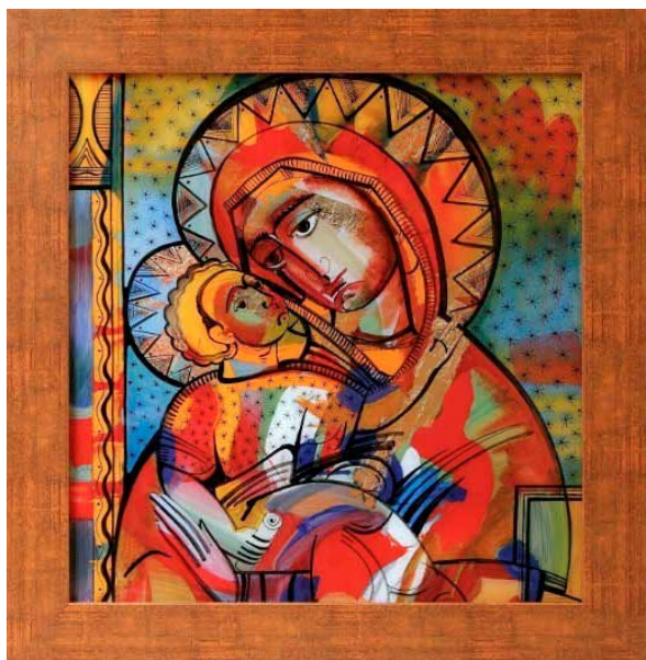
14. Oksana Romaniw-Triska, Matka Boska Eleusa , 2010, szkło, tusz, olej, folia, zbiory prywatne