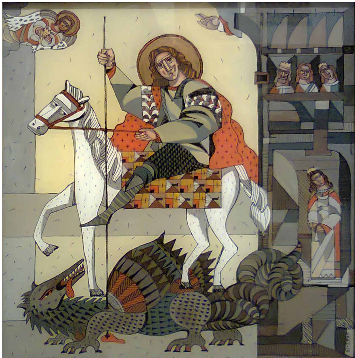
11. Oksana Andruszchenko, św. Jerzy , 2015, szkło, tusz, olej, kolekcja prywatna, fot. O. Andruszchenko