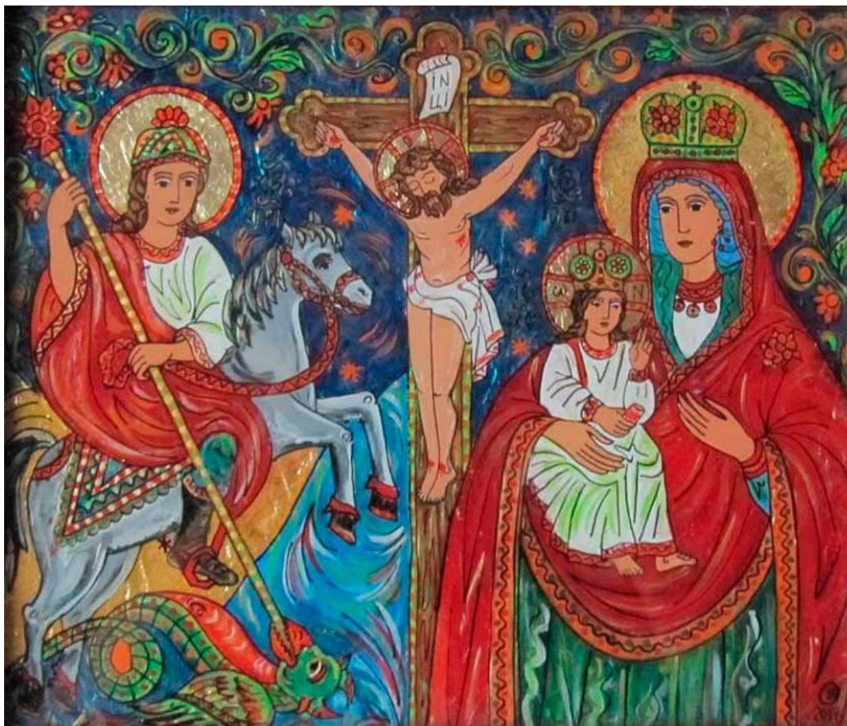
6. Oksana Wynnychok, św. Jerzy, Ukrzyżowanie, Matka Boska z Dzieciątkiem , 2010, szkło, tusz, akryl, złoto płatkowe, własność prywatna