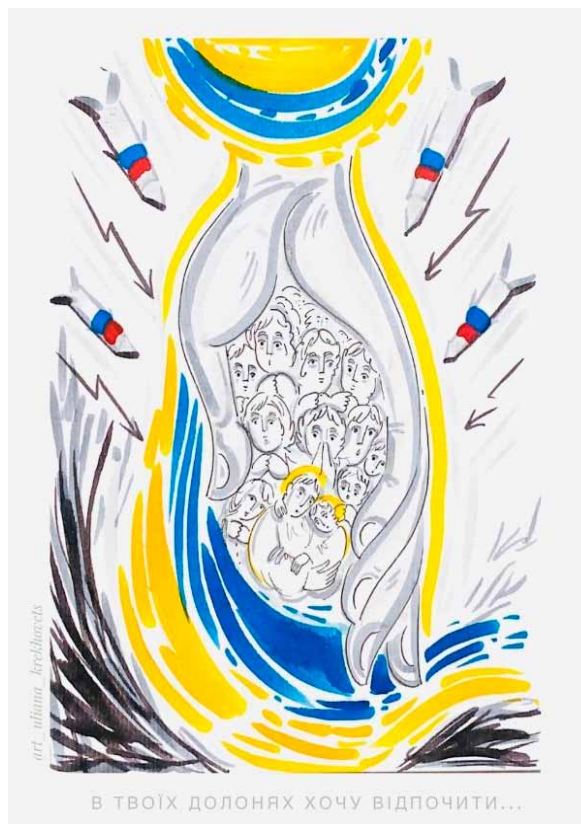
25. Ulana Krechowec, Chcę odpocząć w Twoich dłoniach , 2022, papier, podkłady, markery akwarelowe, własność prywatna