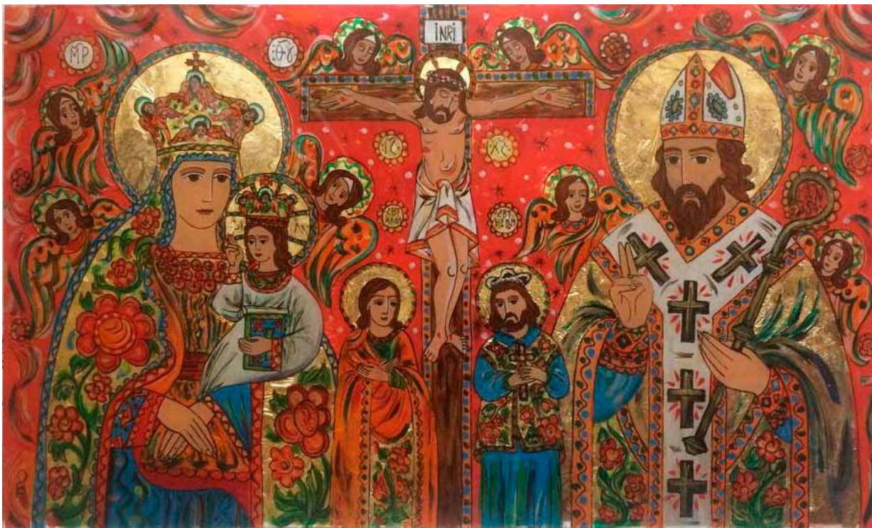
7. Oksana Wynnyczok, Matka Boska Leżajska, Ukrzyżowanie z Czcigodnym Iwanem i Janem Nepomucenem, św. Bazyli , ikona rodzinna, 2017, szkło, tusz, akryl, złoto płatkowe, własność prywatna, fot. A. Wynnyczok