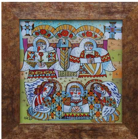
12. Oksana Andruszczenko, Szczęśliwe aniołki , 2020, szkło, tusz, olej, kolekcja prywatna, fot. O. Andruszczenko

12. Oksana Andrushchenko, Happy Angels , 2020, glass, ink, oil, private collection, photo O. Andrushchenko