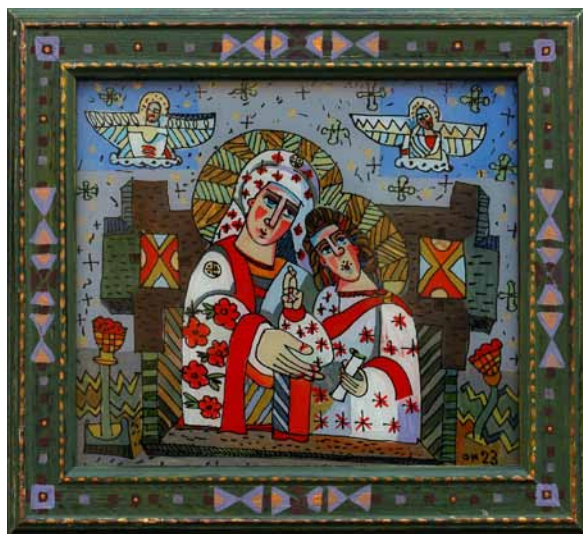
13. Oksana Andruszczenko, Bogurodzica z Dzieciątkiem , 2023, szkło, tusz, olej, kolekcja prywatna, fot. O. Andruszczenko

12. Oksana Andrushchenko, Happy Angels , 2020, glass, ink, oil, private collection, photo O. Andrushchenko