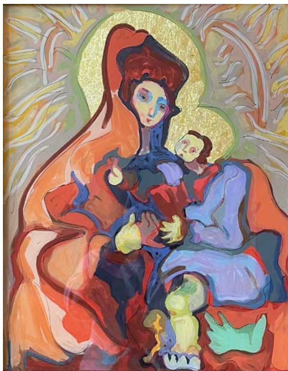
19. Taras Łozynskij, Matka Boska z Jezusem , 2008, szkło, tusz, olej, folia, zbiory prywatne, fot. O. Triska