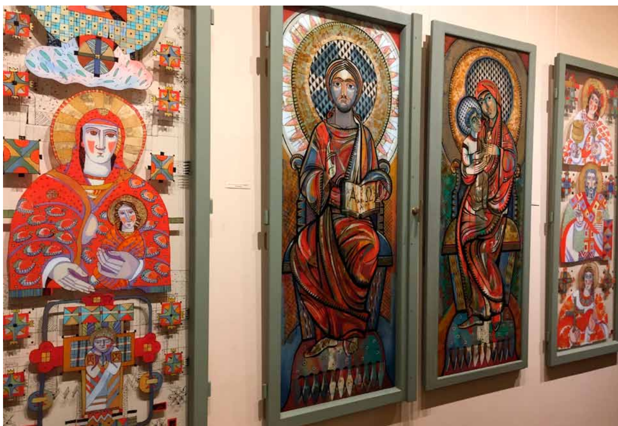
29. Ekspozycja wystawy Aktualizacja. Okna , 2020, galeria „Ikonart”