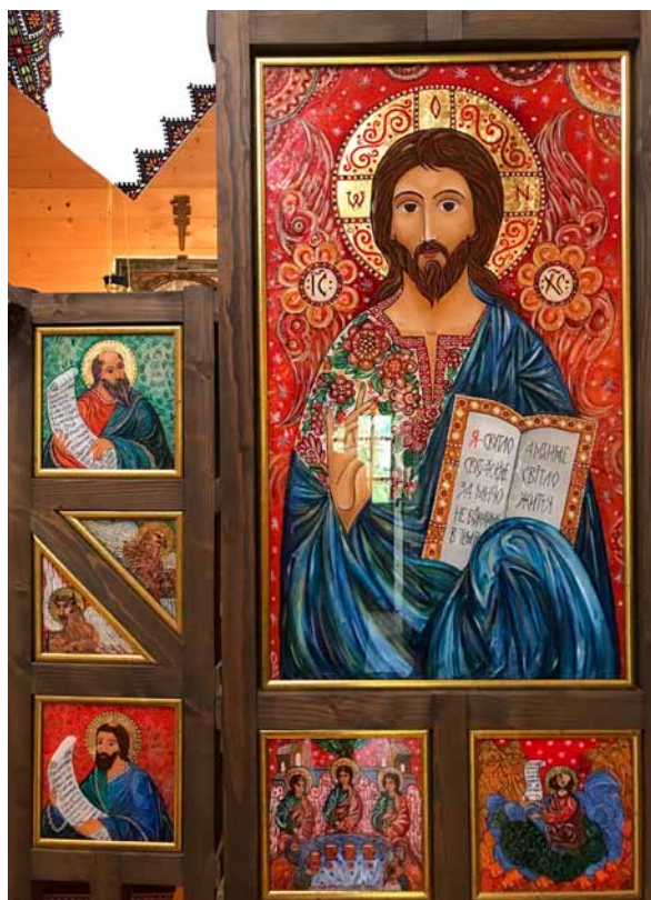
9. Oksana Wynnyczok, fragment ikonostasu

9. Oksana Wynnichok, a fragment of the iconostasis