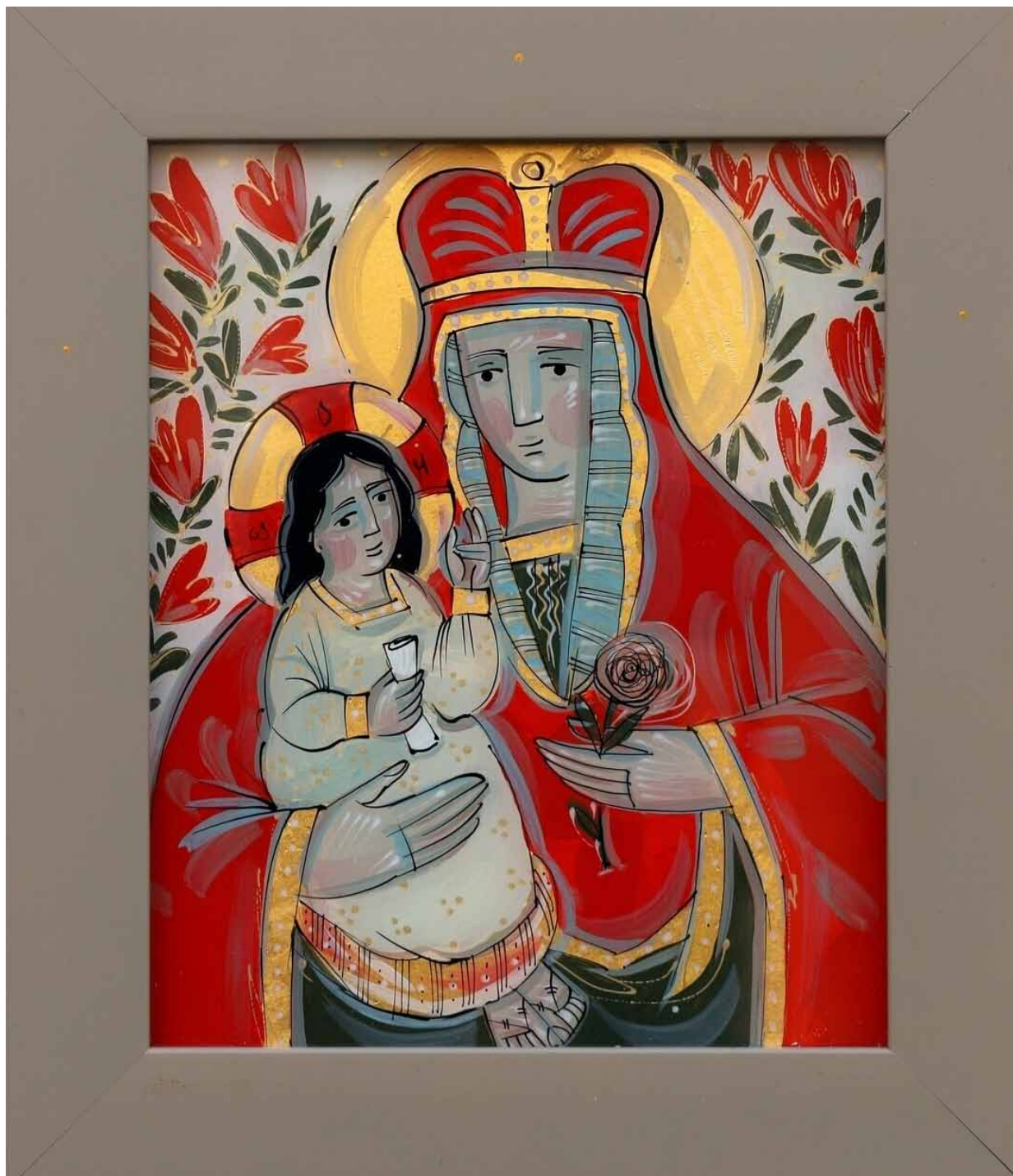
23. Ulana Krechowec, Matka Boża Kwiat Niewiędący , 2022, szkło, akryl, tempera, tusz, zbiory prywatne