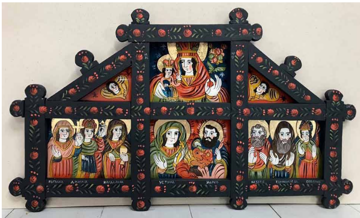
5. Ostap Łozynskij, św. Paraskewa, św. Dmytro, św. Magdalena, św. Ustyna, św. Marek, św. Klymentij Szeptyckij, św. Seweryn , ikona rodzinna, 2020, szkło, tusz, akryl, złoto płatkowe, własność prywatna