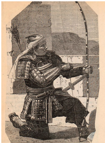
Wojownik orientalny z napiętym łukiem 72

Szczególnie dramatyczne były losy „Imperium Greckiego”, które „skutkiem wewnętrznych sporów dogmatycznych” już w VII w. „raz po raz” traciło prowincje na rzecz muzułmanów: