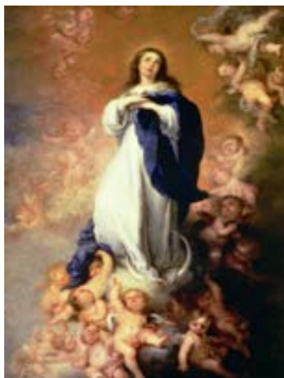
Bartolomé Esteban Pérez Murillo La Inmaculada Concepción de los Venerables (Niepokalane Poczęcie) 1678