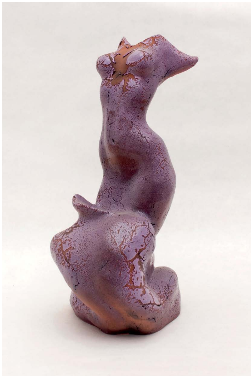
Wira Czernijenko, Spaleni miłością , szamot, glazura, 2015

przesycona jest tęsknotą autorki za wiosną. Artystyczne rozwiązanie tej pracy zbudowane jest na kolorystyczno-figuratywnym nawiązaniu do poszarzałych wiosną śnieżnych zasp, jeszcze zimowego, chłodnego w tonacji, lecz jasnego nieba, mokrej od deszczu kory drzew, pierwszych zielonych liści. Zmienność, niestabilność,