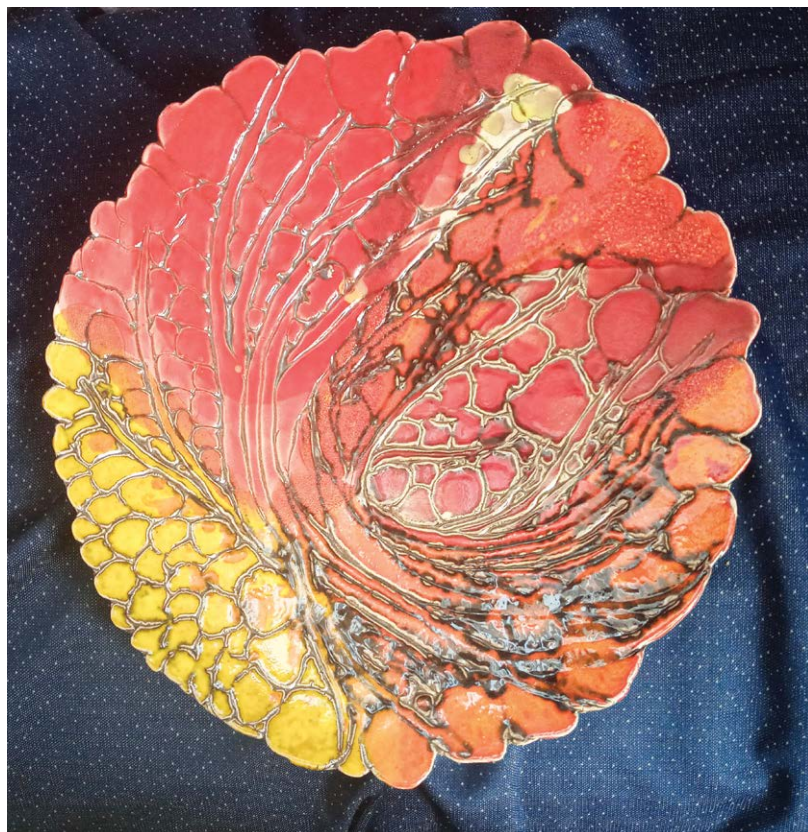
Wira Czernijenko, Karmazynowy kamionka , 2018

ucieleśniały funkcję kommemoratywną 5 . Te kobiece obrazy-symbole w rzeczywistości ujawniły „pewne oczekiwania społeczeństwa dotyczące wrodzonych cech kobiety” i stanowiły wyjątkową manifestację zawartej w nich dyferencjacji płci 6 .