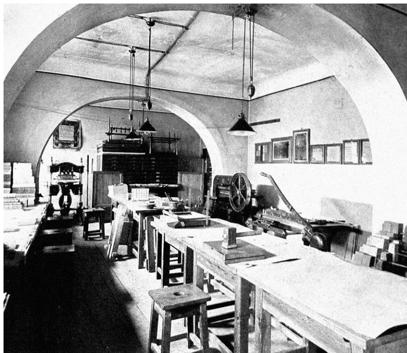
Wnętrze pracowni introligatorskiej zorganizowanej z udziałem B. Lenarta w Muzeum Przemysłowym w Krakowie, później wykorzystywanej przez krakowską Szkołę Przemysłu Artystycznego

Idee zawarte w opracowaniu O drogach wychowania estetycznego opublikowane we wczesnym okresie kariery artystycznej Władysława Skoczylasa towarzyszyły mu