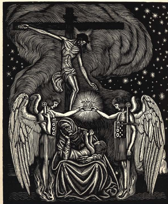
Z bożej łaski (Arzewory)

Latwość, dzięki dużej wprawie w malowaniu obrazów impresjonistycznych, odsuwa go od pogłębiania swej indywidualności. W r. 1908 zostaje nauczycielem rysunków figuralnych w szkole Przemysłu Drzewnego w Zakopanem. I tutaj budzić się zaczyna w artyście protest przeciw zbyt uproszczonemu stosunkowi do natury. Interesować go zaczyna