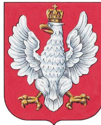
Godło z 1919. Oficjalny herb II Rzeczypospolitej z orłem wzorowanym na klasycystycznym (1919)

[...] rząd zgłosił do Sejmu Ustawodawczego wniosek w sprawie godła i barw narodowych. 1 sierpnia 1919 roku Sejm przyjął ten projekt w ustawie o godłach i barwach Rzeczypospolitej Polskiej. Postanowiono, że Polska po 123 latach niewoli miała odzyskać godło podobne do tego, które straciła w okresie rozbiorów. Główną inspiracją dla projektantów pierwszego herbu państwowego odrodzonej Rzeczypospolitej z 1919 roku został więc wcale nie orzeł piastowski czy renesansowy, ale klasycystyczny z 2. połowy XVIII wieku.