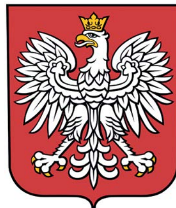
Projekt herbu, Aleksander Bąk, 2009

Opracowanie identyfikacji wizualnej rządu niemieckiego, z uwzględnieniem współczesnych wymogów jej implementacji, również cyfrowej, opracowano już w roku 1996 a oficjalnie wprowadzono w 1999. Od roku 1999 swoje identyfikacje wizualne zmieniło kilka krajów – Holandia, Estonia, Hiszpania, Wielka Brytania, Chile, Francja, Norwegia. Jest zatem materiał do przemyśleń nad taką całościową identyfikacją wizualną państwa. W Polsce tak pojmowany temat identyfikacji