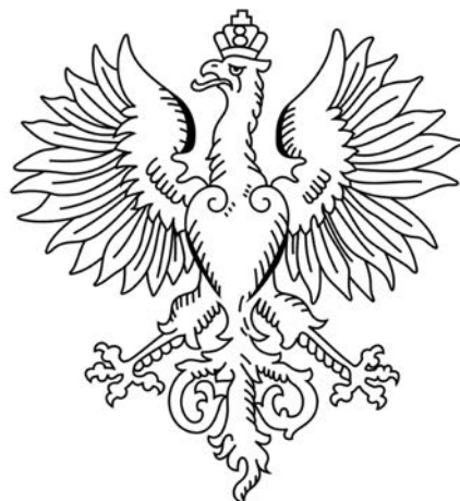
Orzeł Rady Regencyjnej

a także zakresowi tych unormowań, warto przywołać definicję – czym jest współczesna identyfikacja wizualna.