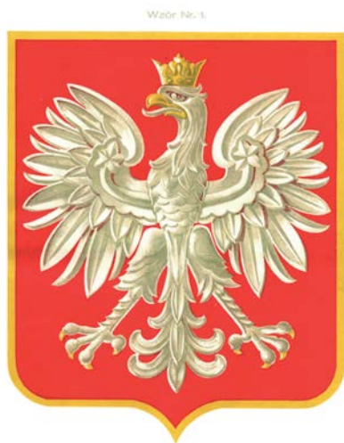
Wzór herbu RP z rozporządzenia Prezydenta z 1927

użyte przez Kromera, jako synonimy, określenia tej czerwieni, wskazują na dużą trudność rozróżnienia odcieni, o ile karmin bywa opisywany jako „kolor ja-skrawoczerwony”, to już szkarłat „mocny, ciemno-