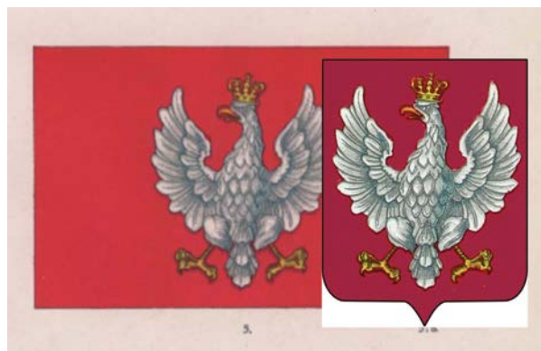
Porównanie skanu załącznika nr 5 z broszury Łoży z domniemanym herbem z tejże broszury

Skan spisu załączników barwnych w broszurze Łoży