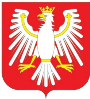
Herb RP, projekt Jerzy Michta, 2017

W jej systemie nie ma oficjalnego, konstytucyjnego orła, trudnego do przeprojektowania ze względów graficznych i legislacyjnych. Występuje on w kształtach nawiązujących do historycznych form heraldycznych, lecz w istocie mamy do czynienia z logo lub piktogramami, które nie muszą się podporządkowywać innym wymo-