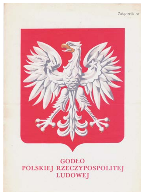
Herb PRL z 1980 r., autor Szymon Kobyliński

Kolejna wersja wyglądu orła Z. Kamińskiego, przerysowanie praktycznie bez rażących zmian, a jednocześnie usankcjonowanie nowego wyglądu herbu (orzeł bez korony), ukazała się wraz z nowym uregulowaniem kwestii symboli narodowych w 1955 r. Jak wspomniano wcześniej, dekret z 7 grudnia 1955 r. 18 powtarza w kwestii barw zapis art. 2 z dekretu z 1927 r. – in extenso . Nie zmienia się zatem odcień barwy czerwonej – cynober. Tu jednak trzeba wskazać jasno, że o ile zapisy normatywne, dotyczące barwy czerwonej, nie zmieniły się od