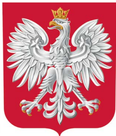
Herb RP, opracowanie wersji elektronicznych, projekt Leszek Bielski, konsultacje Andrzej Heidrich, 2017

Na szczęście Ministerstwo zostało zlikwidowane i orzeł przestał straszyć w przestrzeni publicznej.