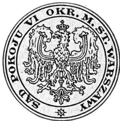
Pieczęć „prawników warszawskich” (styczeń 1917 r.)

Powyższa definicja odnosi się co prawda do firm, ale bez jej naruszenia możemy słowo „firma” zastąpić słowem „państwo”. Zasady jej tworzenia pozostają niezmiennie – im szersza, bardziej szczegółowa, obejmująca wszystkie przewidywalne materiały i technologie, tym lepiej. Różnica między firmą a państwem tkwi w skali rzeczywistych i potencjalnych obszarów ekspozycji znaków firmy i państwa. Podstawowe założe-