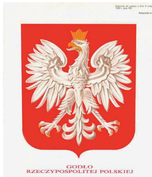
Herb RP, autor Andrzej Heidrich, 1990

Powołana w tym celu komisja zajęła się ostatecznie jedynie przywróceniem korony i pierwotnego kształtu orła projektu Z. Kamińskiego. Z racji zachowania się pierwowzoru w fatalnym stanie Andrzej Heidrich