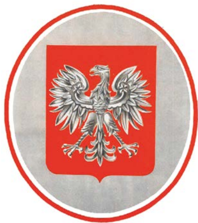
Tablica z godłem Polskiej Rzeczypospolitej Ludowej

obecnych było z jednej strony nieco węższe, a z drugiej mocno obwarowane przepisami. Jeśli do tego dodamy konieczność odtwarzania godła z opublikowanego drukiem wzorca, przestanie dziwić wielość wersji, jakie funkcjonowały w przestrzeni publicznej. Okres ten charakteryzuje również posługiwanie się, równolegle