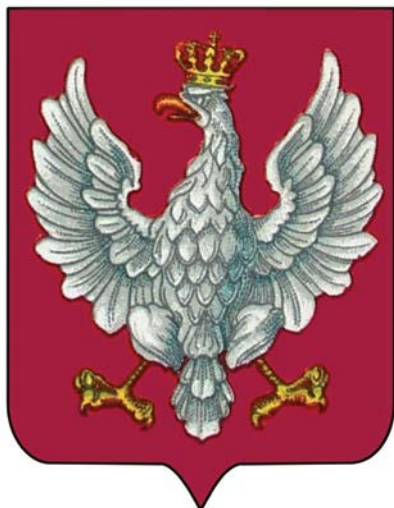
Wzór herbu jakoby pochodzący z broszury Łoży pt. Godło i barwy Rzeczypospolitej Polskiej , 1921

Ustawa jasno stawia sprawę tymczasowości potencjalnego wyglądu herbu, jak i braku jego wzorca. Drugie przekłamanie dotyczy prezentowanego w artykule Pietrasa wzoru herbu podpisanego jako „Oficjalny herb II Rzeczypospolitej”. Wystarczy przyjrzeć się tejże ustawie, a szczególnie dokładnie jej załącznikom. Łatwo to sprawdzić, zaglądając do ustawy z 1919 r. w zasobach Sejmu 6 . Proszę zwrócić uwagę na załączniki