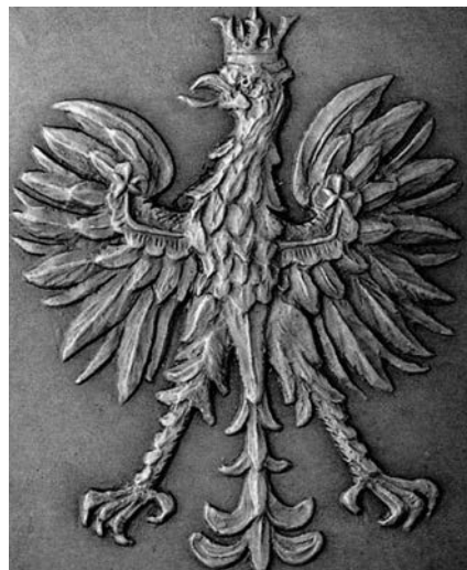
Orzeł z plakiety Elizy Beetz-Charpentier, 1924

W kwestii barwy czerwonej art. 2 rozporządzenia Prezydenta Rzeczypospolitej z dnia 13 grudnia 1927 stanowi jasno: „Barwami państwowymi są kolory biały