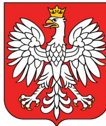
Projekt herbu, Andrzej-Ludwik Włoszczyński, 2010

właściwie nie istniał, a za kolejnych prezydentów Zespół ds. Opracowania Ustawy o Symbolach Państwowych RP nie kontynuował zaczętych w 2005 roku prac.