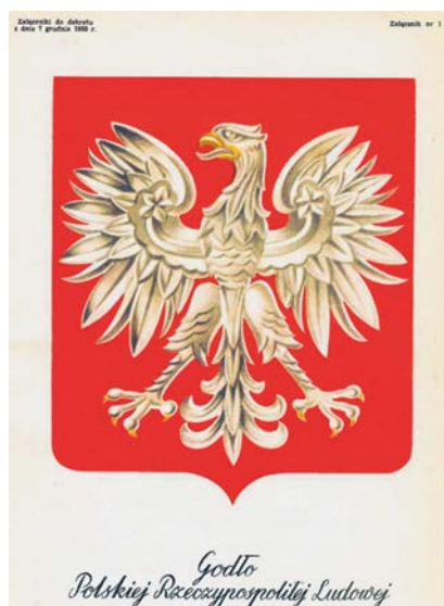
Herb PRL z 1955 r.

Okres powojenny to całkowita zmiana ustroju państwa, a co za tym idzie – przemożna chęć zmiany godła państwa na wzór będący odzwierciedleniem nowej rzeczywistości społeczno-politycznej. Rozpisany w 1946 r. konkurs na projekt herbu państwowego, z zakreślonym kanonem orła bez korony i w duchu orłów piastowskich, ale też zachowujący wytyczną przedwojenną o złotych pazurach, przyniósł co prawda kilka